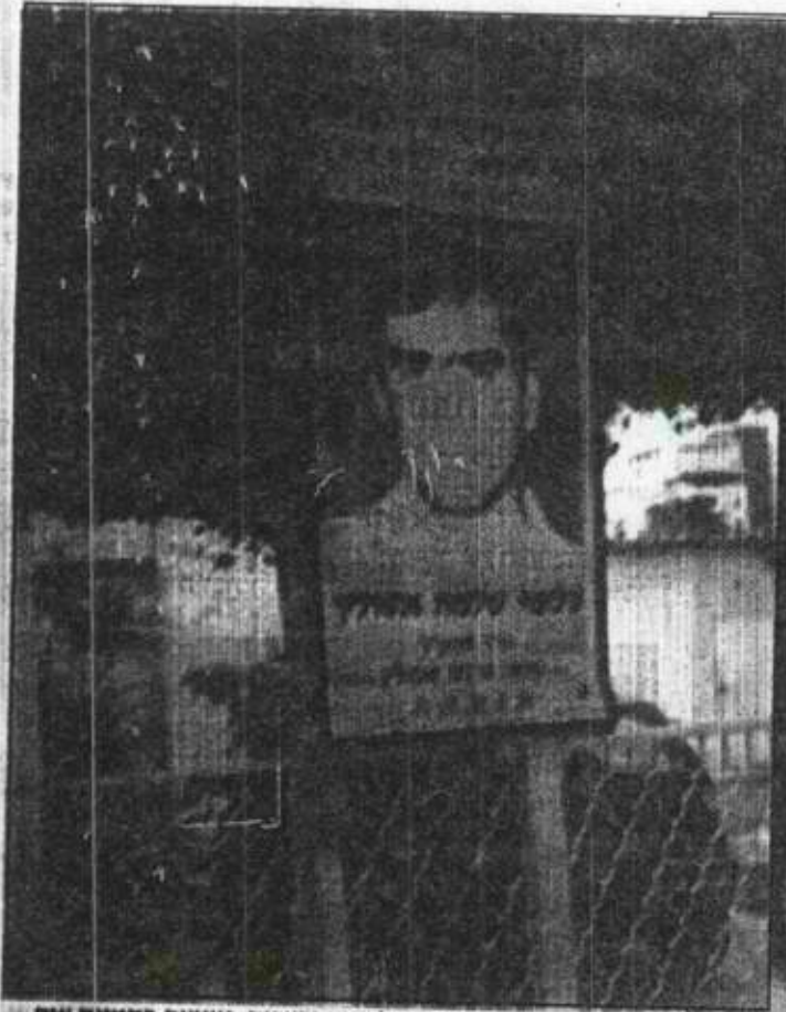
נהרג מאש השוטרים במהלך ההתבצרות, ומונח בהנצחת ענק ליד בית משולם. שלומי אסולין צילום: דא"צ

בגדר גבוהה מונחים כמה עשרות כיסאות פלסטיק לבנים שלא היו בשימוש זמן רב, וכמה עציצים מטופלים היטב מסודרים סמוך לקיר האבן הלבן. שום דבר מן המראות הללו לא מסגיר את מה שהתרחש כאן, בקצה רחוב ביאליק הצדדי, והנחוק כל כך מהמולת העיר, רק לפני 6 שנים. אלימות, יריות, מטוסים וניירות משטרה לא מתחברים למקום הזה.