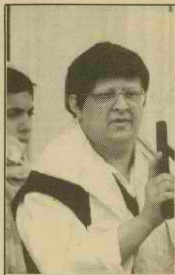
הרב משולם. נראה אותך גבר

היית מקורב בעבר לשלום עכשיו. איך אתה מסתדר עם המתנחלים מקרב אנשי