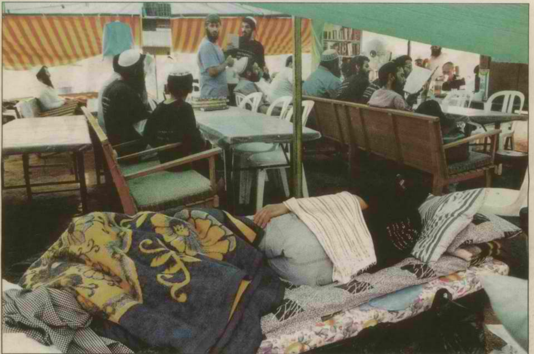
האוהל הגדול בחצר. כאן ישנים, לומדים, ומאוינים לנאומים. הרב יודע הכל, אבל אסור לדבר על הרבה דברים עם אנשים שלא באמונה, כי זה יכול להזיק להם*